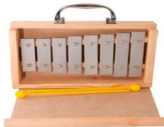
(Referencia de metalófono)