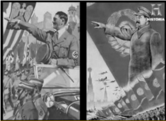
1) Afiche alemán y afiche soviético, ambos con sus líderes como protagonistas