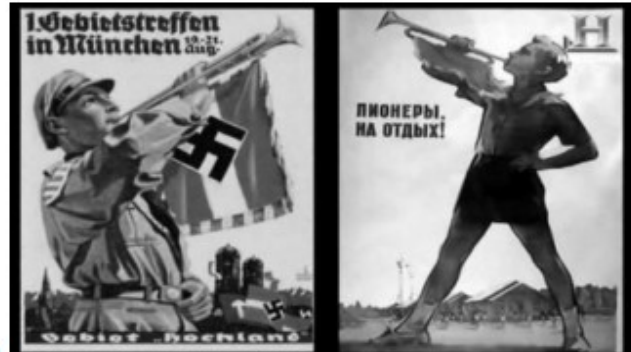
4) Afiche alemán y afiche soviético, con un militar por el lado alemán y un niño por el lado soviético

1) Observando las imágenes (1,2,3 y 4) cuidadosamente y todos los símbolos ¿qué elementos característicos de los gobiernos totalitarios se pueden encontrar? Analiza y deduce.