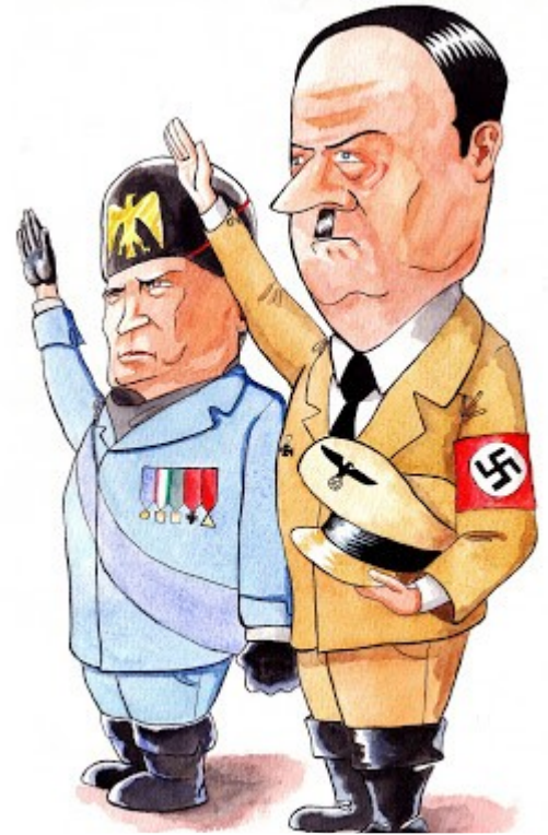
Benito Mussolini (fascismo) y Adolf Hitler (nazismo)

Crisis de los gobiernos democráticos: En Europa, después de la IGM, la mayoría de los países tenían un gobierno democrático, sin embargo luego de la Crisis del 29 y todas las consecuencias que trajo ésta como el desempleo y la miseria hizo que las personas se sintieran defraudadas por sus gobiernos al no saber combatir con la crisis económicas.