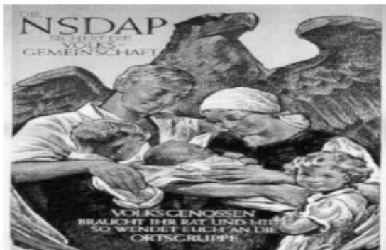
3) Afiche alemán en el cual se representa a una familia y un águila (animal símbolo del Alemania)